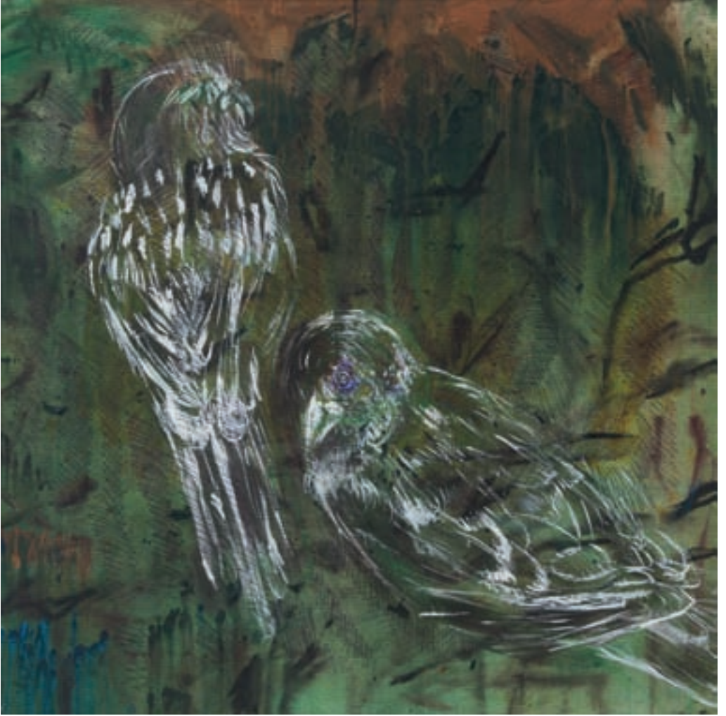
SERÇELER | SPARROWS tuval üzeri akrilik acrylic on canvas 70 x 70 cm., 2014