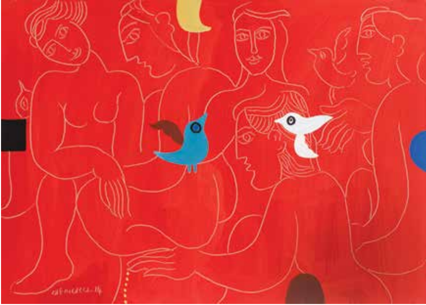
İSİMSİZ | UNTITLED tuval üzeri akrilik acrylic on canvas 100 x 140 cm., 2014