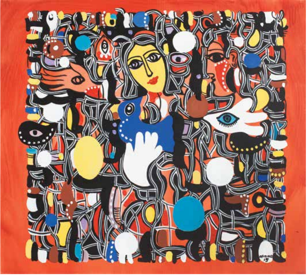
İSİMSİZ | UNTITLED tuval üzeri akrilik acrylic on canvas 100 x 110 cm., 2015