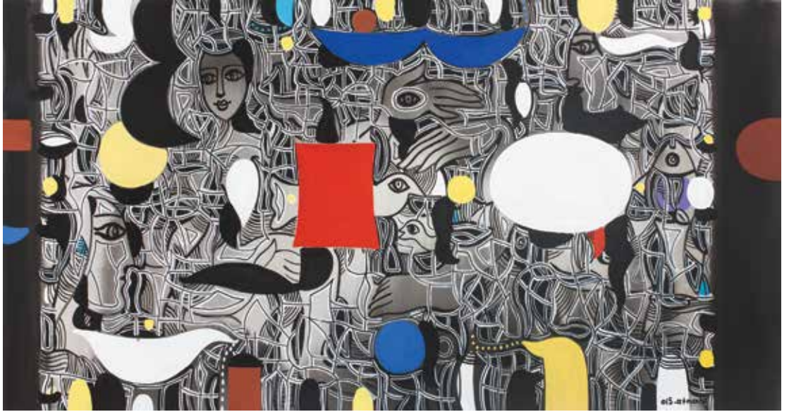
İSİMSİZ | UNTITLED tuval üzeri akrilik acrylic on canvas 100 x 190 cm., 2015