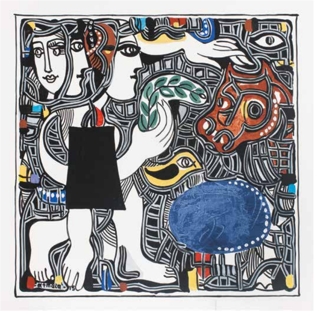
İSİMSİZ | UNTITLED tuval üzeri akrilik acrylic on canvas 80 x 80 cm., 2015