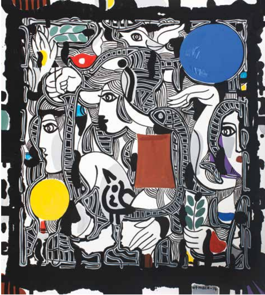
İSİMSİZ | UNTITLED tuval üzeri akrilik acrylic on canvas 110 x 100 cm., 2015