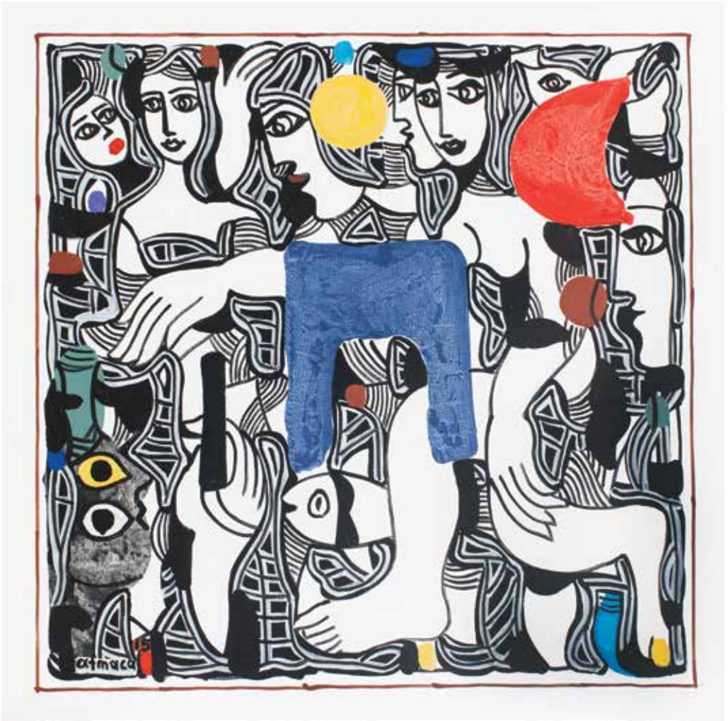
İSİMSİZ | UNTITLED tuval üzeri akrilik acrylic on canvas 80 x 80 cm., 2015