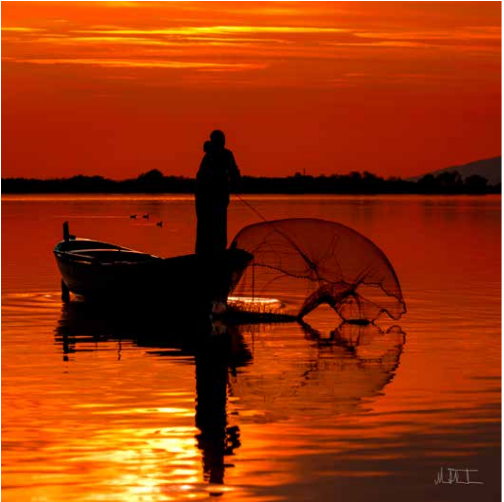
RASTGELE! | GOOD LUCK! DIASEC Lambda C-Baskı, 5 Edisyon DIASEC Lambda C-Print, 5 Editions 75 x 75 cm.