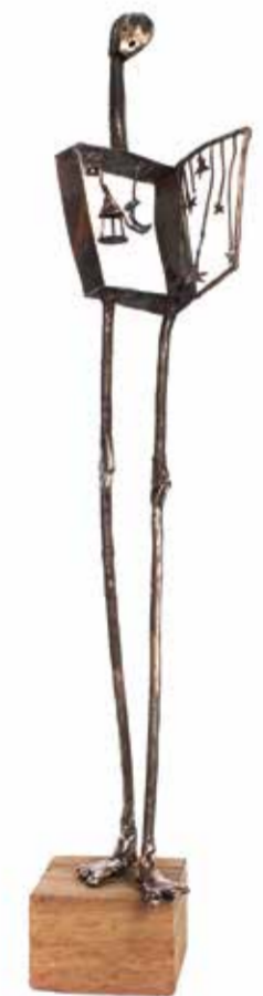
SİBEL ÇETİN GECE bakır, gümüş ve ahşap 39 x 8 x 13 cm., 2015