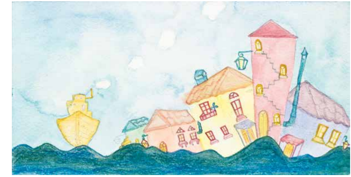
SİBEL ÇETİN VAPUR kağıt üzeri karışık teknik 15 x 29,5 cm., 2015