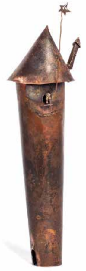
SİBEL ÇETİN YILDIZLI KULE bakır, gümüş 14 x 4 x 5 cm., 2015