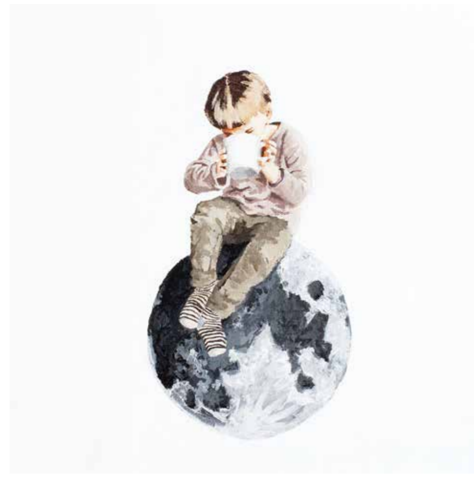
AYŞE TOPÇUOĞULLARI SÜT tuval üzeri akrilik 30 x 30 cm., 2015

2015 Galeri 5 "Teneffüs", İstanbul 2015 Mamut Art Project, İstanbul 2014 THE SECOND INTERNATIONAL ART COLONY Bosna Hersek 2013 Galeri Soyut, Ankara "Küçük Şeyler" Resim Sergisi 2013 Summart Campus, Moldova 2013 Galeri No:2 Karma Resim Sergisi, İzmir 2012 35. DYO resim yarışması, İstanbul, İzmir, Ankara, Antalya, Gaziantep, Erzurum, Rusya / Krasnodar 2012 "Masal Masal Matitas" Projesi, Türkiye, İtalya, Macaristan 2011 Günümüz Sanatçıları Sergisi, Akbank Sanat, İstanbul 2010 29. Günümüz Sanatçıları Sergisi, Akbank İstanbul 2009 "Telaşa Mahal Yok // No Room for Panic" Outlet // İhraç Fazlası Sanat Galeri, İstanbul 2009 "Açık Alan" Soyer Kültür ve Sanat Fabrikası, İzmir 2008 33. DYO Resim Yarışması 2008 3. Uluslararası Çağdaş Sanat Festivali (Fabrikartgroup) "Su-Pırıltı" Kapadokya 2008 Siemens Sanat Sınırlar-Yörüngeler 04, İstanbul