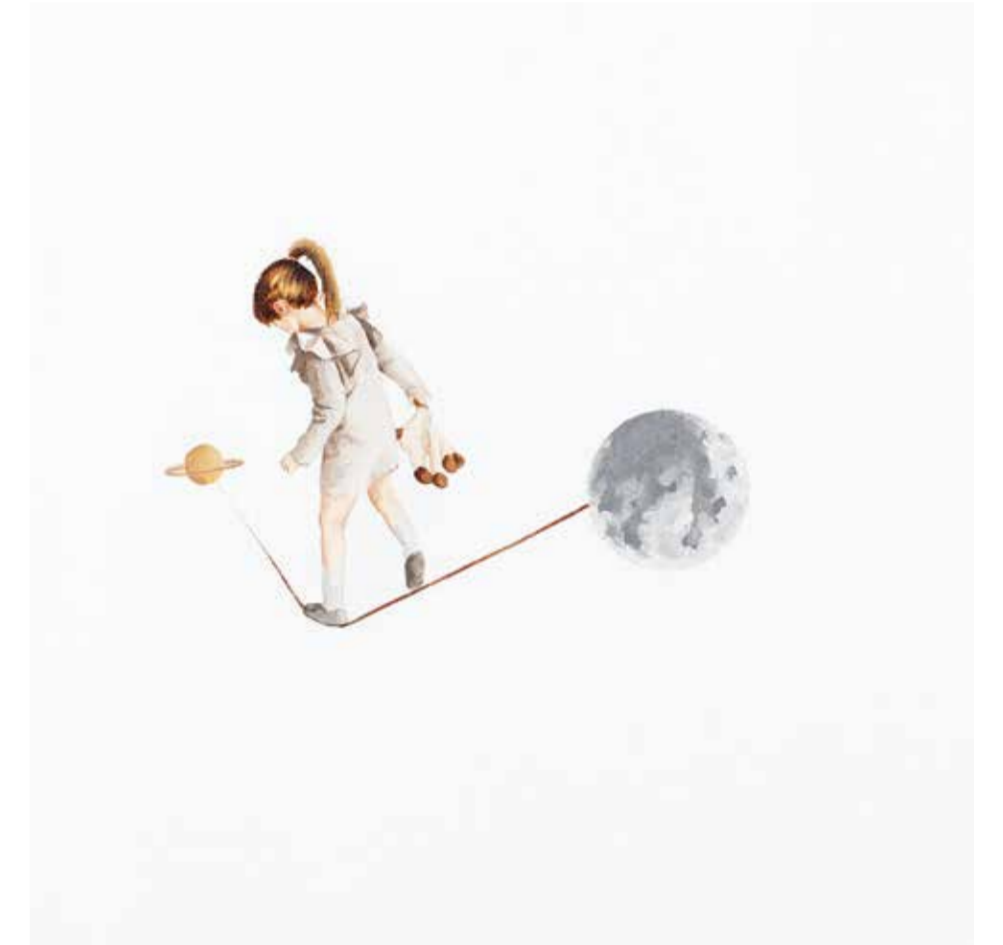
AYŞE TOPÇUOĞULLARI İSİMSİZ tuval üzeri akrilik 30 x 30 cm., 2015