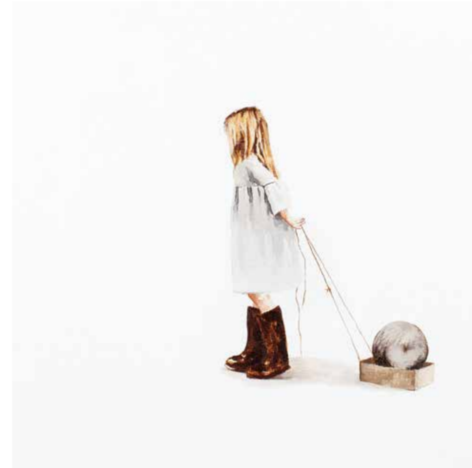
AYŞE TOPÇUOĞULLARI PLÜTON tuval üzeri akrilik 30 x 30 cm., 2015