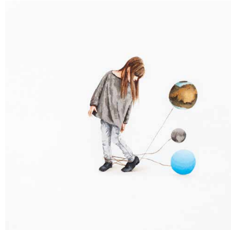
AYŞE TOPÇUOĞULLARI BALON 2 tuval üzeri akrilik 30 x 30 cm., 2015