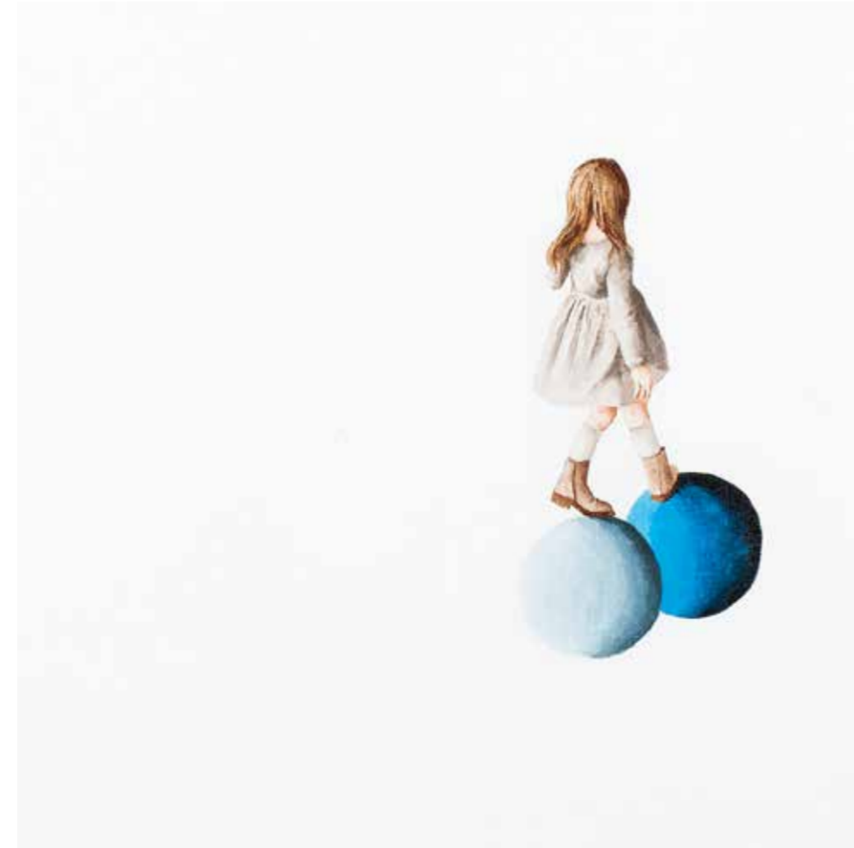
AYŞE TOPÇUOĞULLARI MAVİ tuval üzeri akrilik 30 x 30 cm., 2015