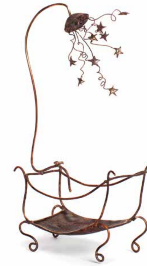
SİBEL ÇETİN GECE bakır, gümüş 18 x 10 x 5 cm., 2015