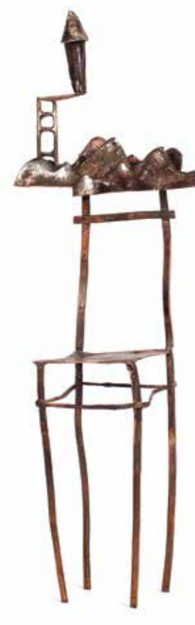
SİBEL ÇETİN SANDALİYE 2 bakır, gümüş 24 x 8,5 x 4,5 cm., 2015