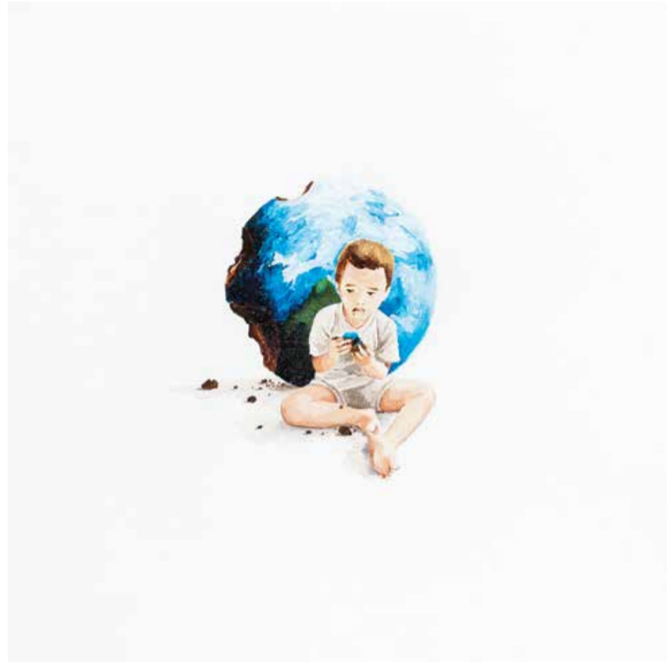
AYŞE TOPÇUOĞULLARI KURABIYE tuval üzeri akrilik 30 x 30 cm., 2015