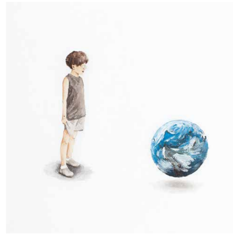
AYŞE TOPÇUOĞULLARI SU VE BUZ tuval üzeri akrilik 30 x 30 cm., 2015