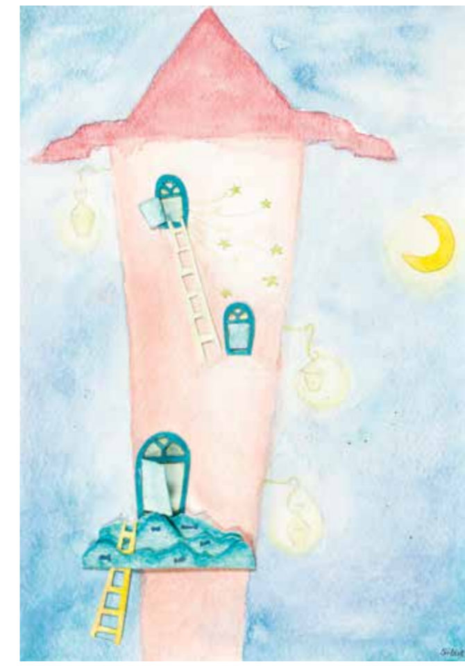
SİBEL ÇETİN KULE kağıt üzeri suluboya 29,5 x 21 cm., 2015