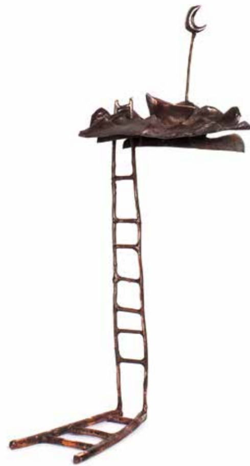
SİBEL ÇETİN YOLCULUK 3 bakır, gümüş 26 x 12,5 x 9,5 cm., 2015