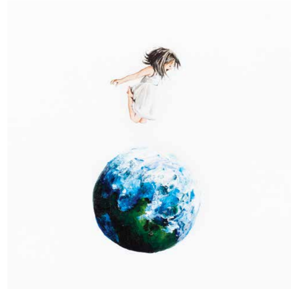
AYŞE TOPÇUOĞULLARI OYUN tuval üzeri akrilik 30 x 30 cm., 2015