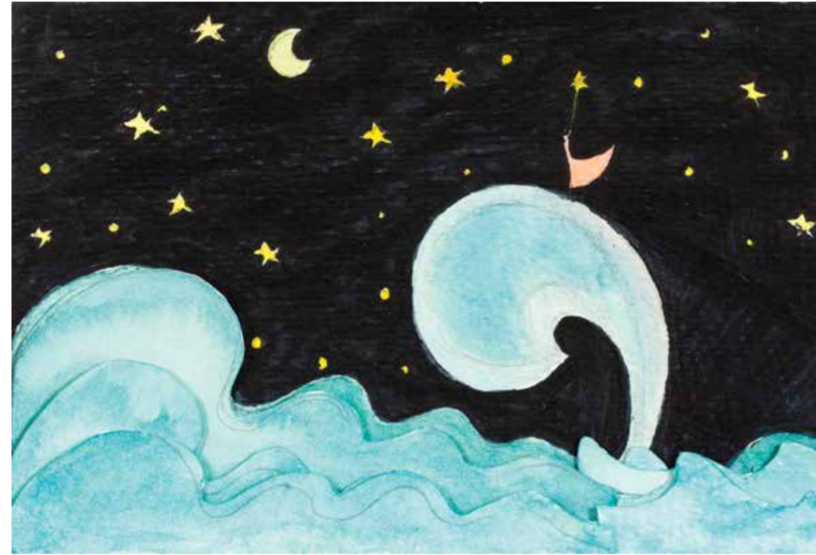
SİBEL ÇETİN DALGALAR kağıt üzeri karışık teknik 10,5 x 15,5 cm., 2015