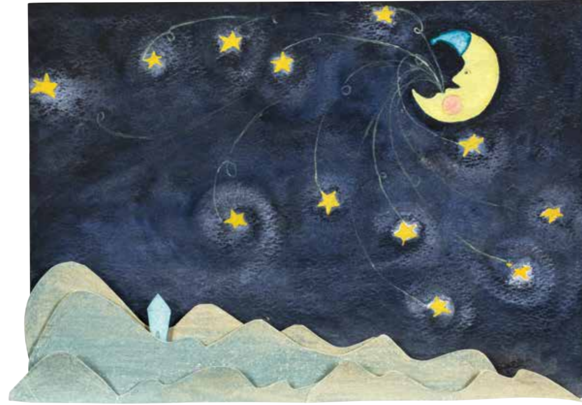
SİBEL ÇETİN AY DEDE kağıt üzeri suluboya 21 x 29,5 cm., 2015

Sanatçı çalışmalarını İstanbul'da sürdürmektedir.