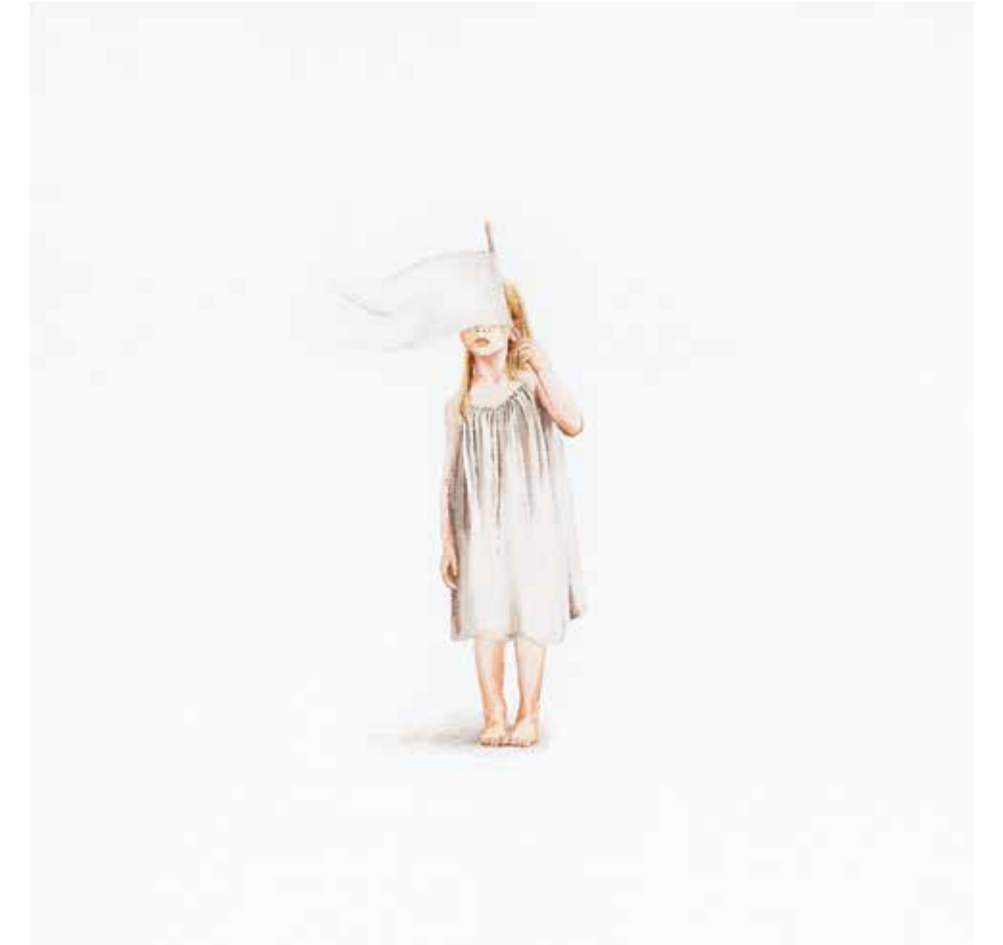
AYŞE TOPÇUOĞULLARI İSİMSİZ tuval üzeri akrilik 30 x 30 cm., 2015