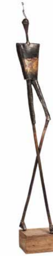
SİBEL ÇETİN MÜZİK AY bakır, gümüş ve ahşap 50 x 7 x 7 cm., 2014