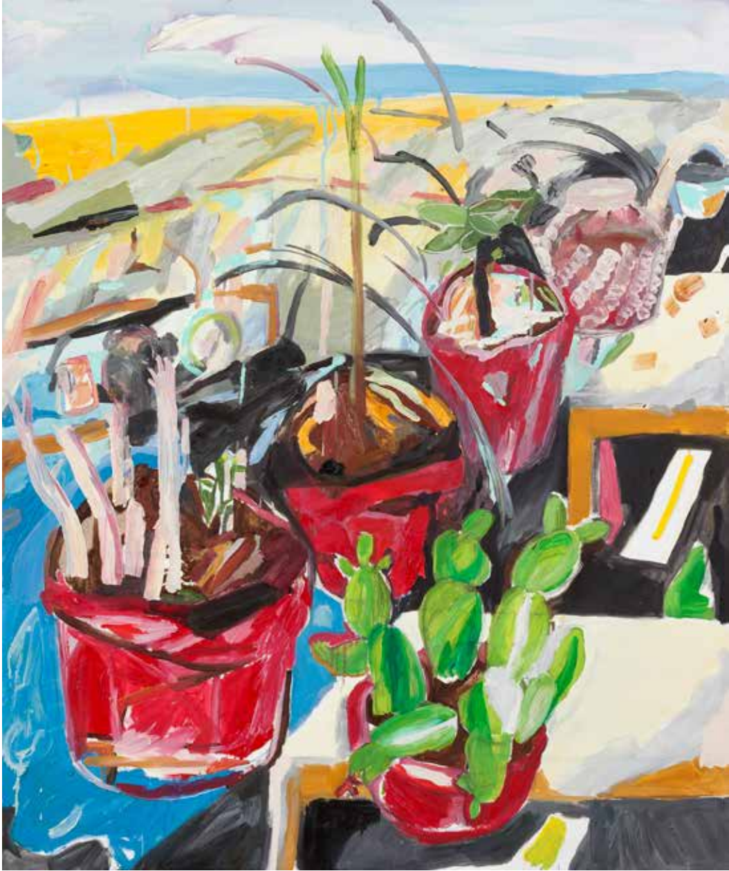
Saksıları Sıraya Koydum/Put My Planters in a Row, 2019 Tuvall Üzeri Yağlıboya, Oil On Canvas. 120 x 100 cm