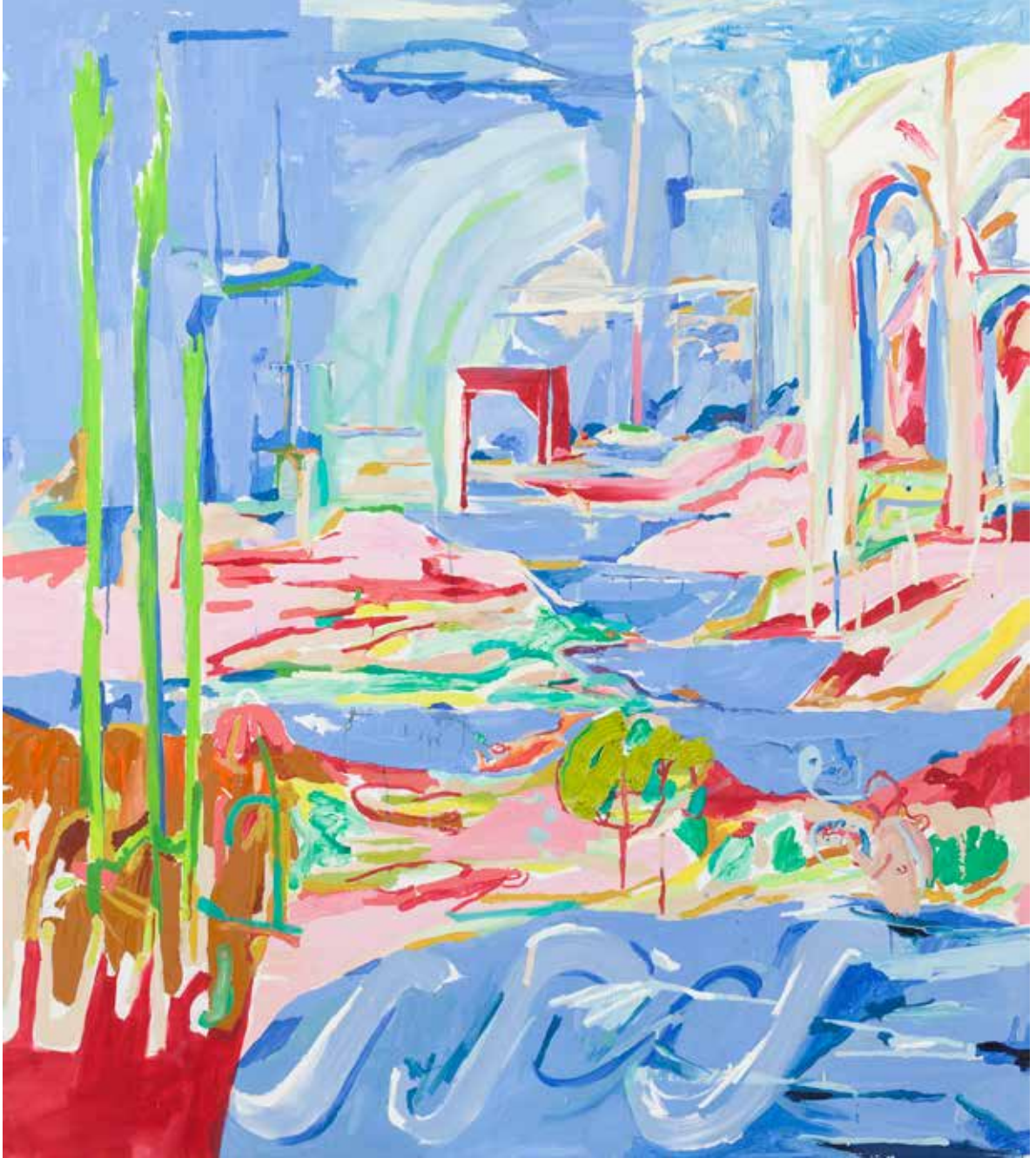
Kanalından Akan Uslu Arzu/Channelled Desire, 2020, Tuval Üzeri Yağlıboya, Oil On Canvas. 170 x 150 cm