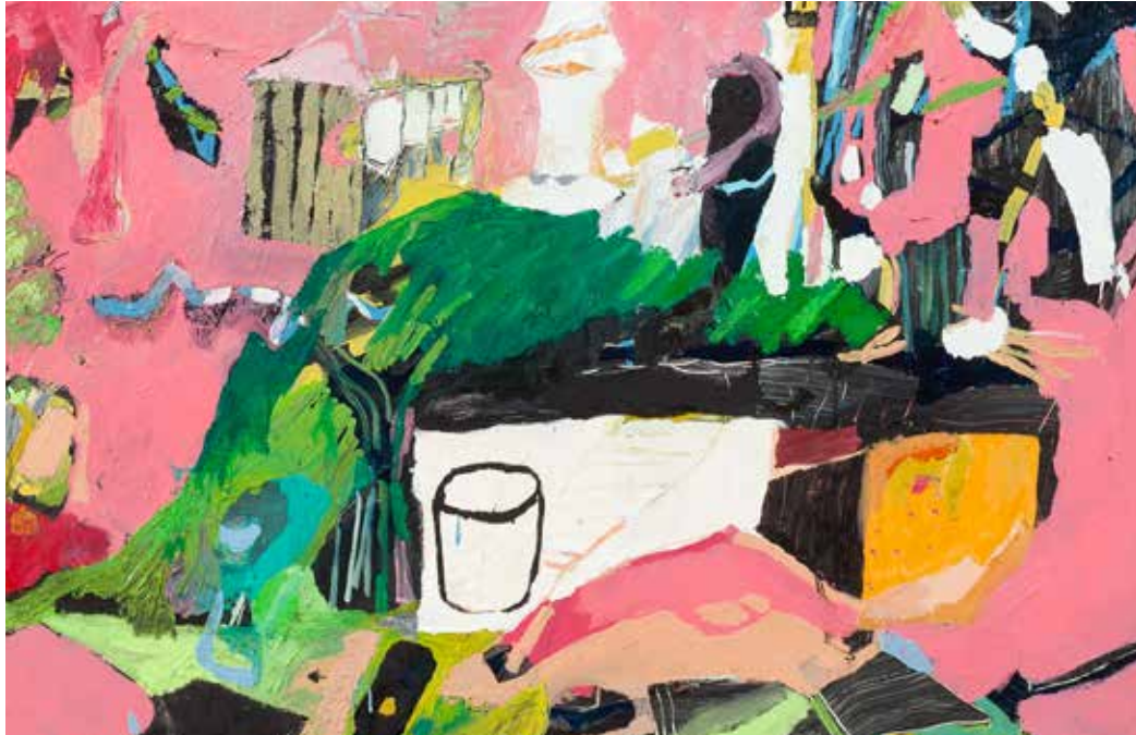
Sarıç, Bardak, Silah/Cistern, Cup, Gun, 2019, Tuval Üzeri Yağlıboya, Oil On Canvas. 40 x 60 cm

And, that is why I built the pantry of good feelings.