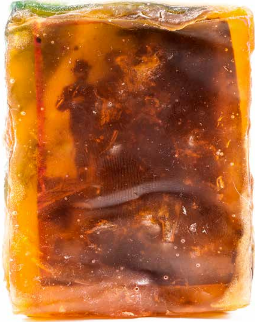
Temizle!/Clean it up! Renkli Sabun Bazı ve Kağıt ile Karışık Teknik Heykel Mixed Media Sculpture with Glycerine, Colored Soap Base and Paper 8 x 5,5 x 2 cm