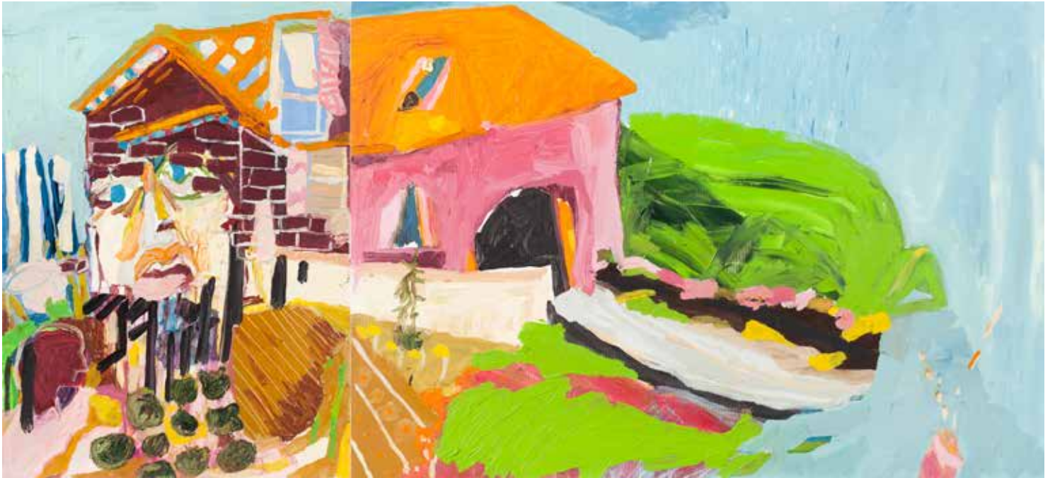
Ev ve Kadının Melezi/Hybrid of a Woman and a House, 2019 Tuval Üzeri Yağlıboya, Oil On Canvas. 60 x 120 cm

While it seems like the jars of flour and sugar are the only bearers of vital substances in the room, our bodies and our very existence are containers too. We are vessels of fat, organs, muscles, ligaments, bones, blood and lymph all wrapped tidily inside our flesh. Contrary to the common misperception that the storage of memories are localised inside the hippocampus, a specific region of the brain, memories are everywhere else. We simply do not hold all of our memories inside the crinkly surfaces of the soft tissues of our brain. Each and every cell of all the aforementioned tissues in our body hold memories, some generated by our own life experience and others we have inherited. This is because we live and learn with our bodies in movement in space. Kinaesthetic memories have a way of unraveling themselves when we move freely. The body unleashes its memories when given the freedom, the time and the space. Whether it is a whole body movement during a dance improvisation or the movement of your hand scribbling away on a piece of paper, images will appear as though they are rolling off your finger tips.