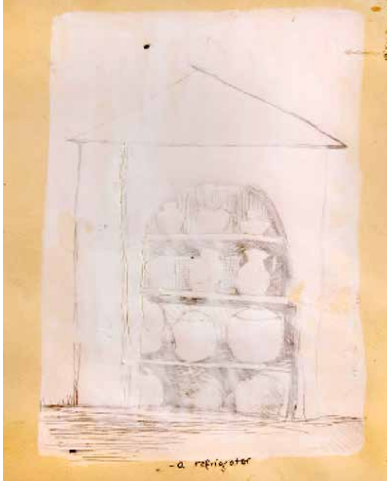
Buzdolabı/Refrigerator, 2009 Bronz Uçlu Kalemle Guaj Üzerine Çizim Bronze Point Drawing on Guashe. 18 x 11 cm

Pandeminin başından beri, kiler kavramı ve stoklama pratiklerine hepimizin aşinalığı arttı. Hayatta kalma dürtüsünün bir uzantısı olan bu pratikler, 'Ya bir gün bulamazsam?' endişesiyle, besleyici olan şeylerin bozulmayacak bir şekilde haznelere konup, saklamasını ve biriktirilmesini içeriyor. Varlığın yokluk ihtimaline karşı farklı şekillerde depolanması ve istiflenmesi, tüm bu düzenin ve bolluğun estetiği insanda ölüm kaygısını teselli ediyor.