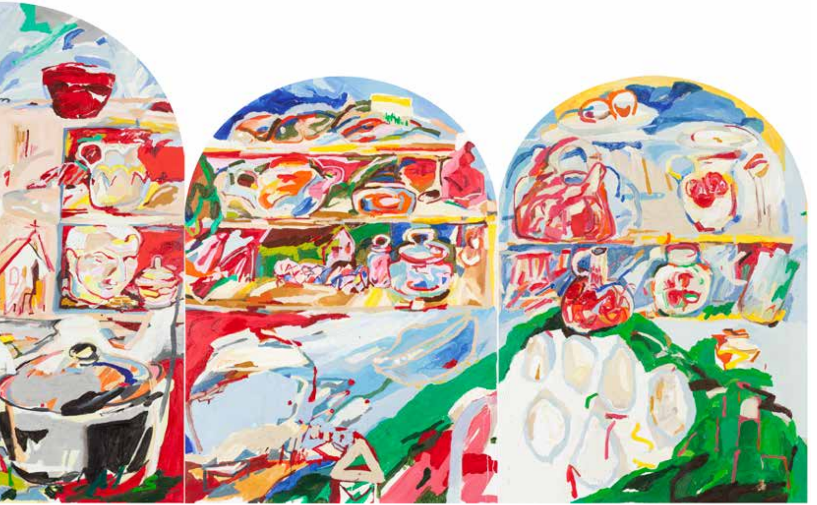
Hafıza ve Kişisel Mitlerin İnşası/Making of Personal Myths and Memories, 2020 Tuval Üzeri Yağlıboya, Oil On Canvas. 180 x 520 cm

Deneyimin mutfağında, anılar ve mevcut An'ın deneyimi, geçmiş ve gelecek sıklıkla iç içe geçiyor. Merkez panelin soluna, en kenardan başlayarak bakacak olursak birinci panelde bir mutfağı evyesinin tam ortasından alınmış bir kesitten görüyoruz. Limonun suyunun sıklığı tezgah, bulaşıkların yıkandığı, kirli suyun akıp diğer sulara karıştığı deneyim mutfak bu panelde resmediliyor.