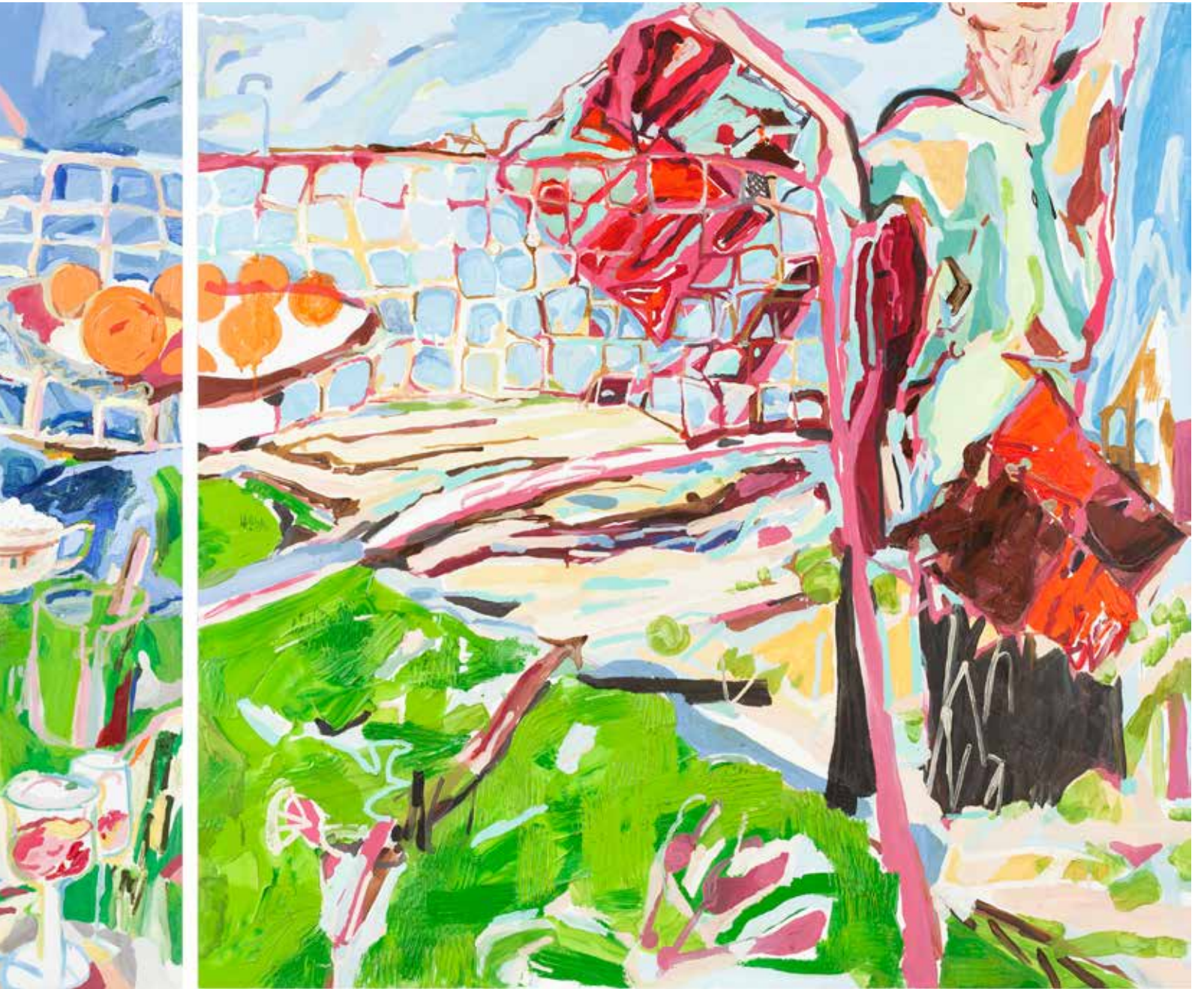
Plato Evresi Badminton Oynamaya Benzer/Plateau is a Game of Badminton, 2019, Tuval Üzeri Yağlıboya, Oil On Canvas. 135 x 320 cm