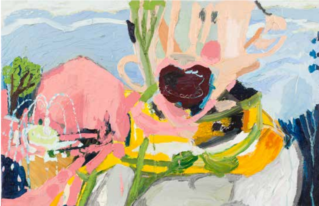
Hazne ve İnsanın Melezi/Hybrid of Man and Vessel, 2019, Tuval Üzeri Yağlıboya, Oil On Canvas. 40 x 60 cm

I bottle up my feelings, shelve my longings, watch them curd and pickle, don't you?