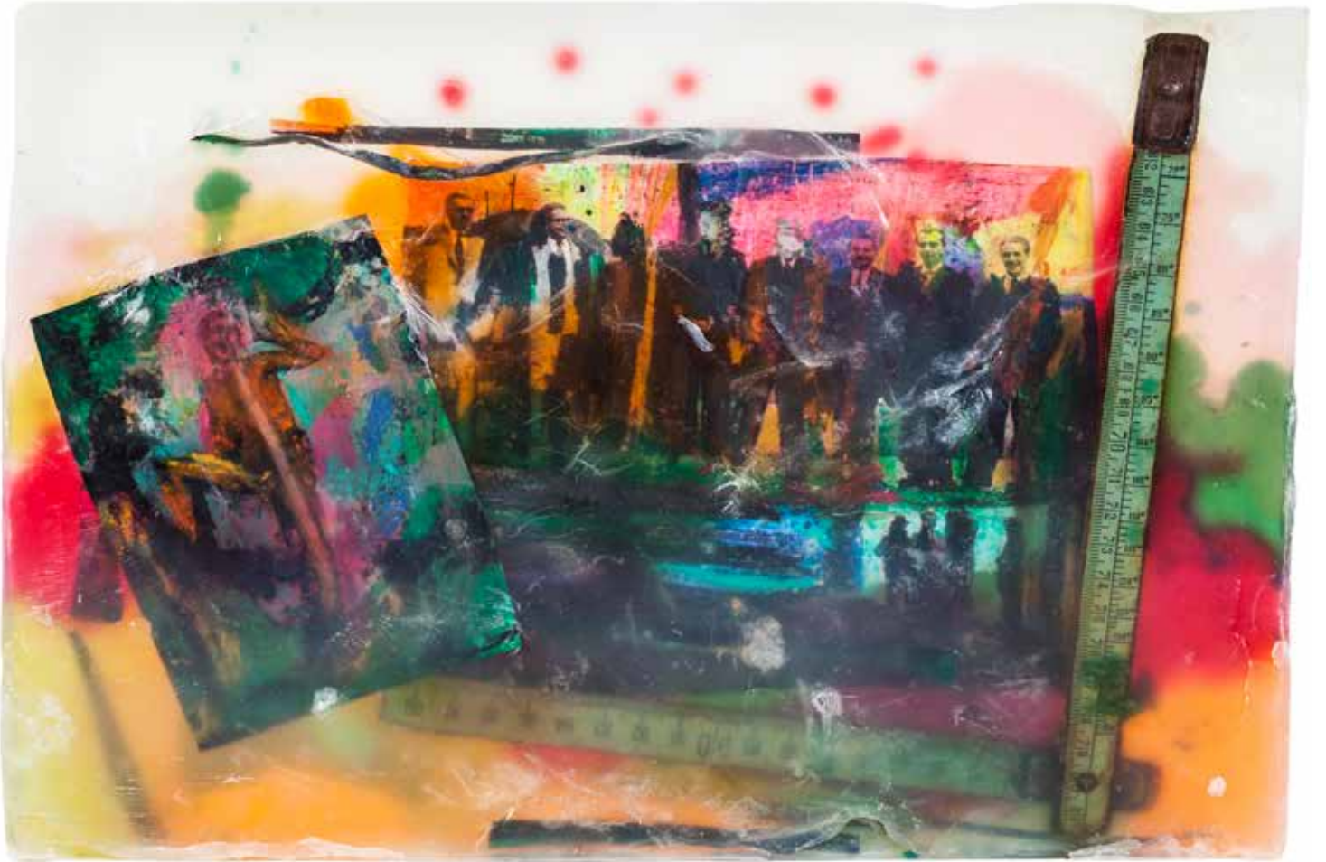
Medeniyet Ölçüsü/Measure of Civilization Renkli Sabun Bazı, Ahşap Mezura ve Kağıt ile Karışık Teknik Heykel Mixed Media Sculpture with Glycerine, Colored Soap Base, Paper and Other Found Objects. 8 x 4 x 8 cm