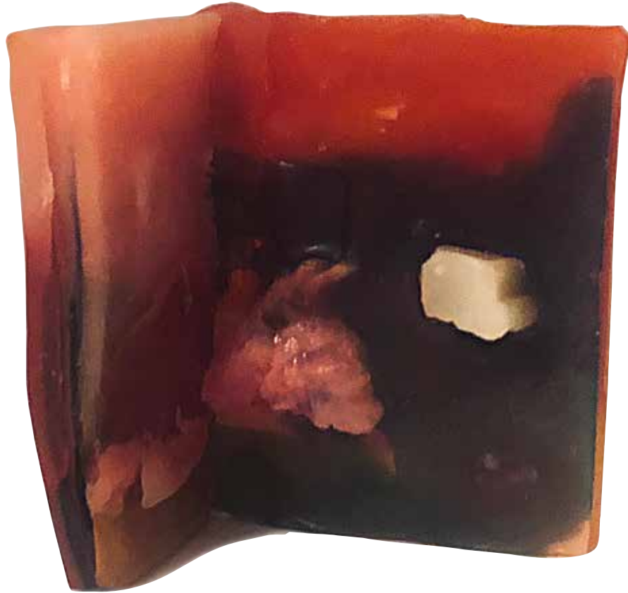
Nancy Testinin Sonucu: Vadideki Beyaz Ev/ Result of The Nancy Test: A White House High in The Valley Renkli Sabun Bazı ve Gliserinden Yapılmış Rölyef Heykel, Relief Sculpture, Glycerin and Colored Soap Base 8 x 4 x 8 cm

Gözüme beliren ilk şey ise, gök ile yeri birbirine kavuşturan ve aynı zamanda onları birbirinden ayıran bir aşağı bir yukarı oynayan hareketli bir ufuk çizgisi. Yine karşımda dağlar ve tepelerle kendini gösteren manzara resmi. Sanıyorum, Nancy'nin testinin sonucu çıkıyor: Demek ki, hangi malzemeyi kullanırsam kullanayım önümde bir ufuk beliriyor, ortaya tuhaf bir manzara resmi çıkıyor. Manzaranın ortasında dağın yamacına iliştilmiş kübik beyaz sabun parçası beyaz bir ev gibi görünüyor.