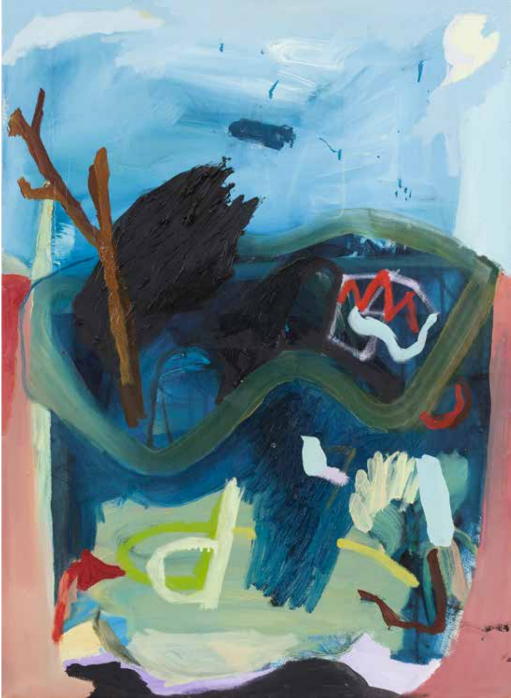
İlk Hazne/First Vessel, 2011, Tuval Üzeri Yağlıboya, Oil On Canvas. 100 x 70 cm