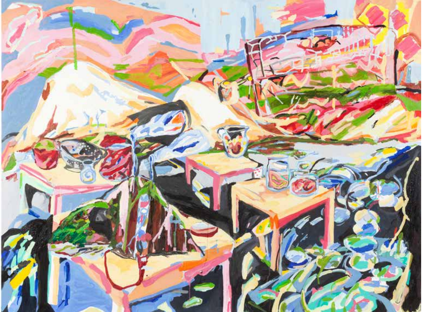
İnsan Cinsel Döngüsünün Dört Evresi İçin Dört Masa ve Top Dışarda! (Diptik) Four Tables for The Four Phases of The Human Sexual Response Cycle and Birdie Landed Outside The Baseline, 2019 (Diptich) Tuvall Üzeri Yağlıboya, Oil On Canvas. 135 x 200 cm