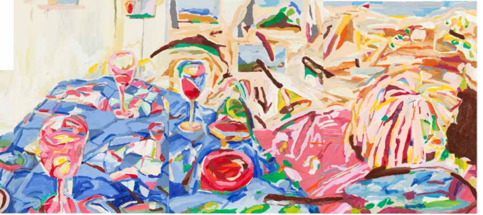
Ailemin Genesis Hikayesi/Genesis of My Family, 2019, Tual Üzeri Yağlıboya, Oil On Canvas. 90 x 370 cm