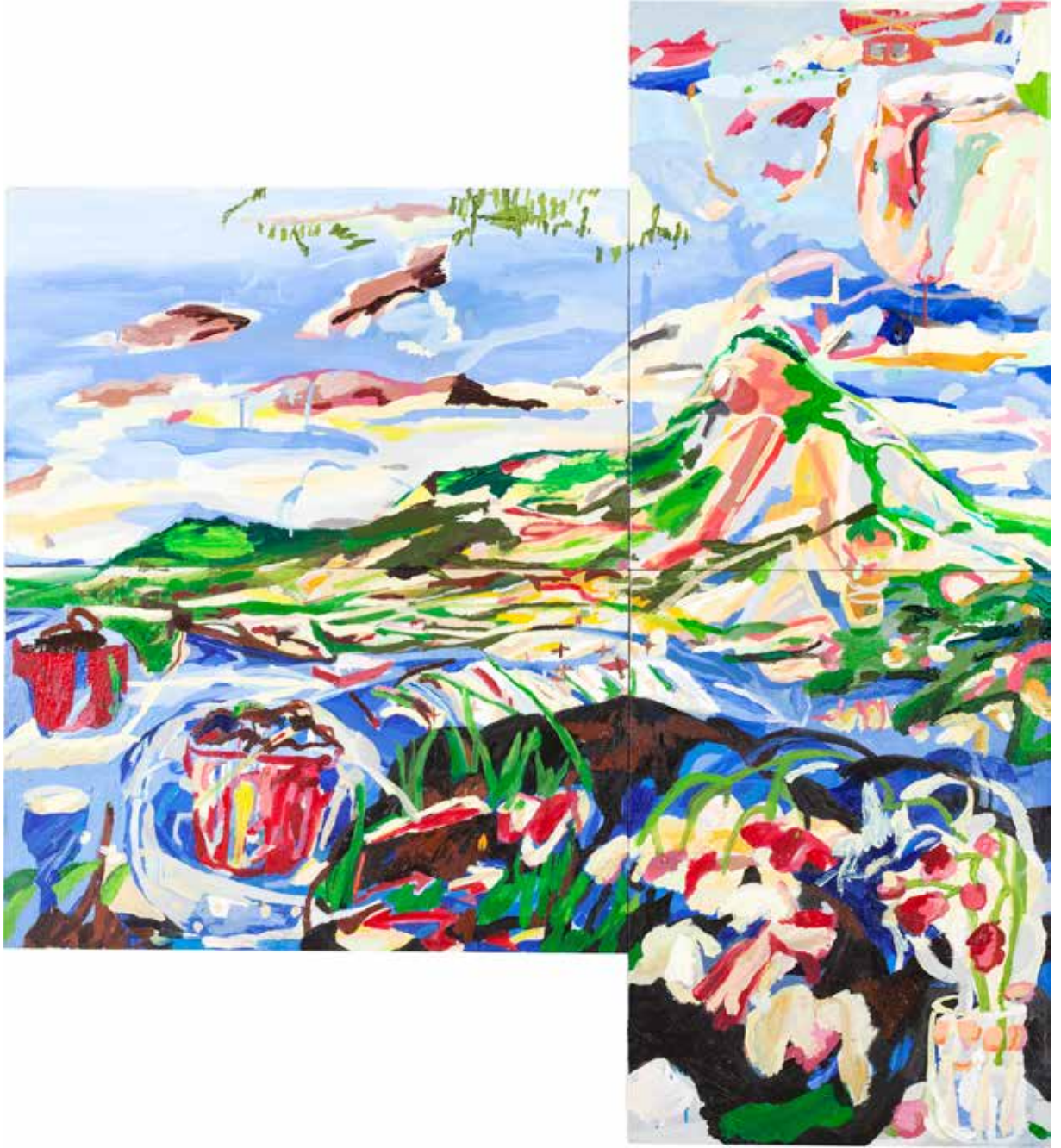
Bölük Pörçük Arzular/Fragments of Desire, 2019, Tuval Üzeri Yağlıboya, Oil On Canvas. 180 x 150 cm