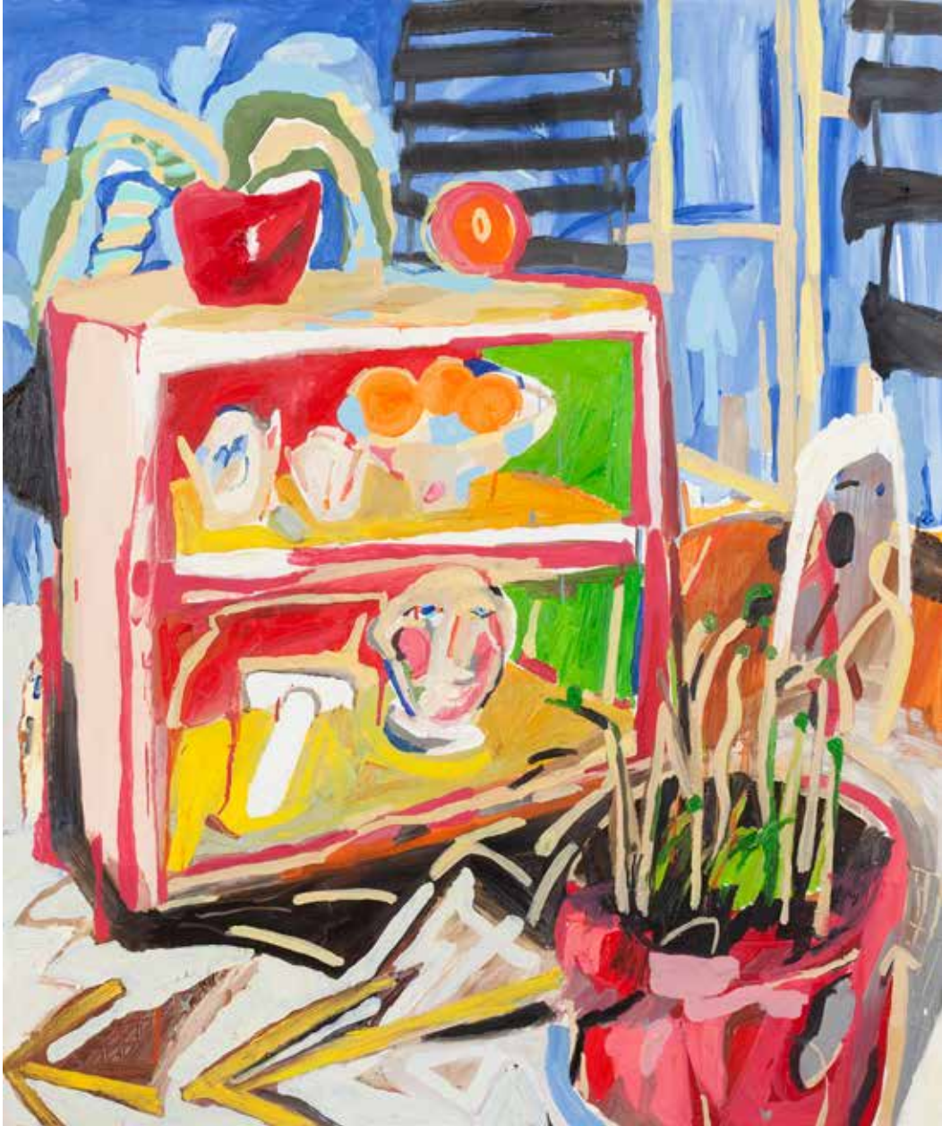
Bir Kiler Yaratmak/Building a Pantry, 2019 Tuval Üzeri Yağlıboya, Oil On Canvas. 120 x 100 cm