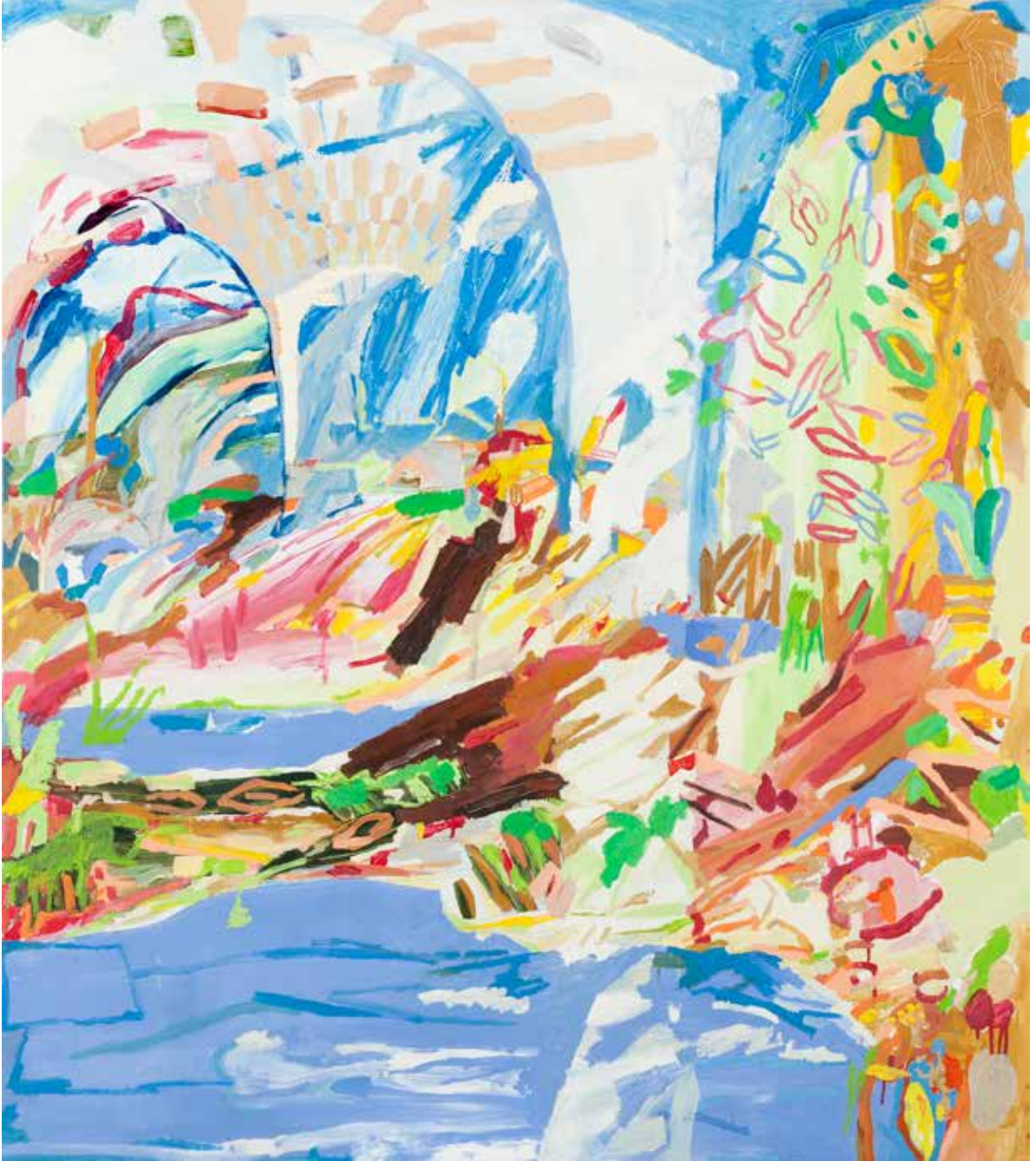
Cennetsi Arzu/Heavenly Desire, 2020, Tuval Üzeri Yağlıboya, Oil On Canvas. 170 x 150 cm