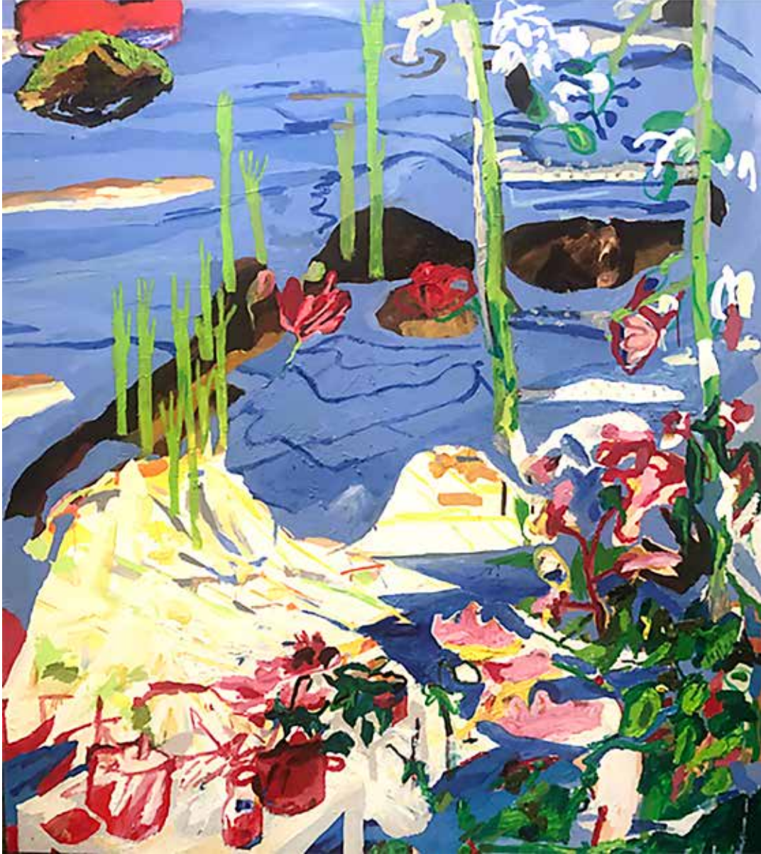
Çözülme/Resolution, 2019, Tuval Üzeri Yağlıboya, Oil On Canvas. 170 x 150 cm Özel Koleksiyon, Private Collection