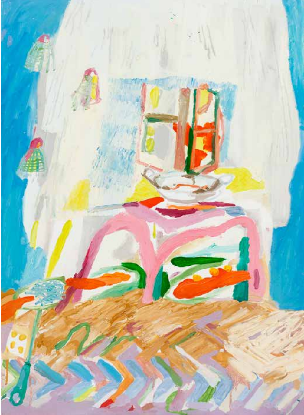
Küçük Bir Orgazm, Small-O, 2019, Tuval Üzeri Yağlıboya, Oil On Canvas. 90 x 60 cm