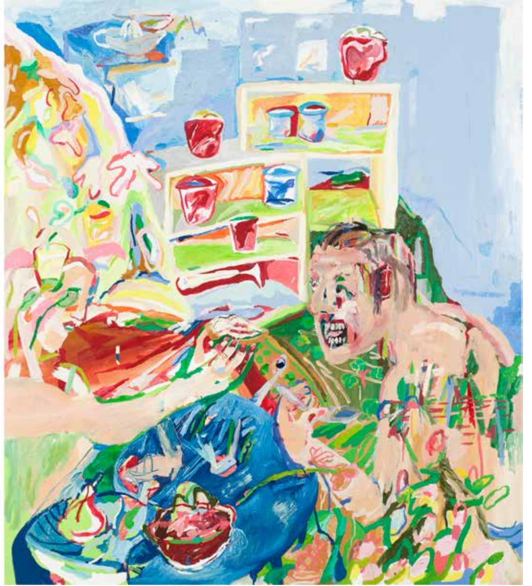
Uçsuz Bucaksız Arzular/Boundless Desires, 2020, Tuval Üzeri Yağlıboya, Oil On Canvas. 170 x 450 cm