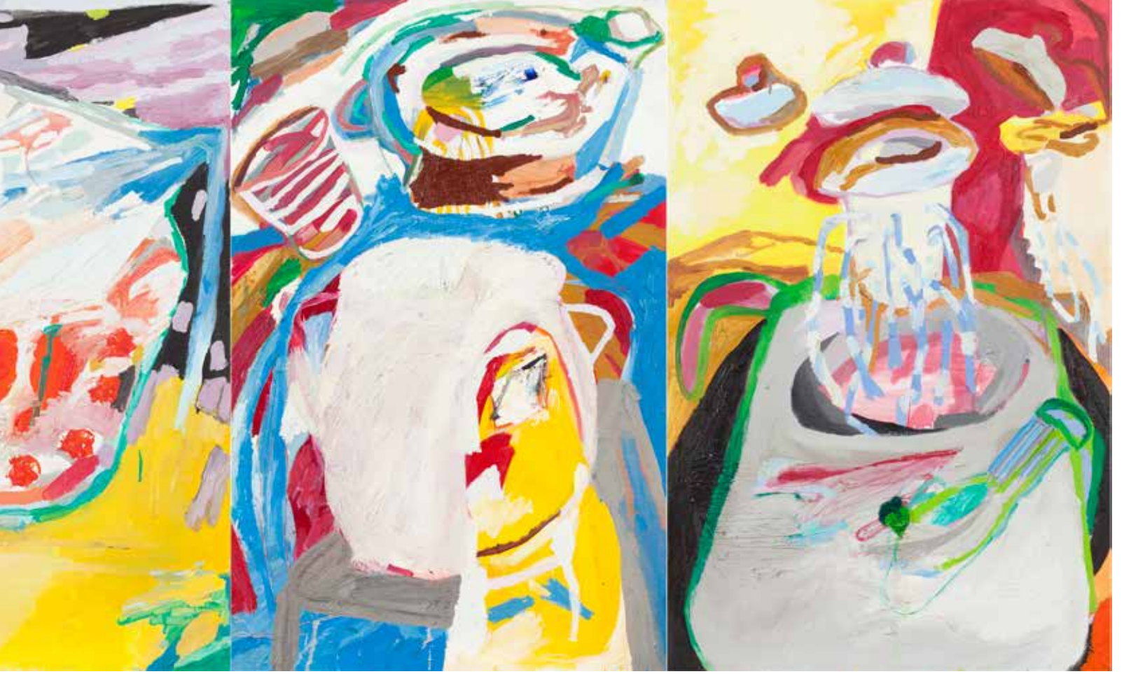
Özlem ve Kavuşmanın Yüzleri/Wall of Longing and Embrace, 2019, Tuval Üzeri Yağlıboya, Oil On Canvas. 90 x 300 cm