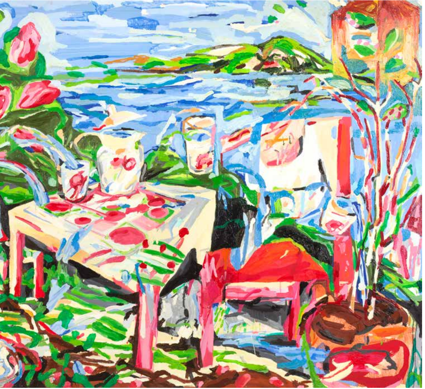
Gümüřlük'te Yarım Bir Tanrıça, Half-a-Goddess in Gümüřlük, 2020, Tuval Üzeri Yağlıboya, Oil On Canvas. 135 x 260 cm