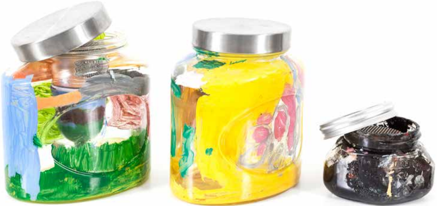
İyi Hislerle Dolu Bir Kiler / Birbirlerine Şiir Okuyan Kavanozlar/Pantry of Good Feelings, 2020 Boyanmış Mutfak Eşyaları İçine Ses Yerleştrimesi, Sound Installation inside Found Objects. 135 x 135 x 70 cm

İyi hislerle dolu bir kiler, neye benzer, içinde neleri barındırır? Sizin yaşamınızın doruk deneyimlerinde kendi kendinize fısıldadığınız seslerden oluşan bir hafıza olsaydı, tekrar tekrar dinlemek ister miydiniz?